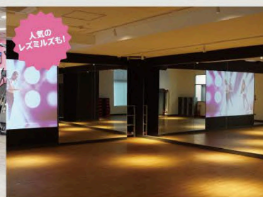
ヴァーチャルスタジオ