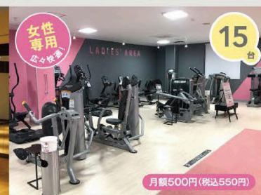
レディースエリア